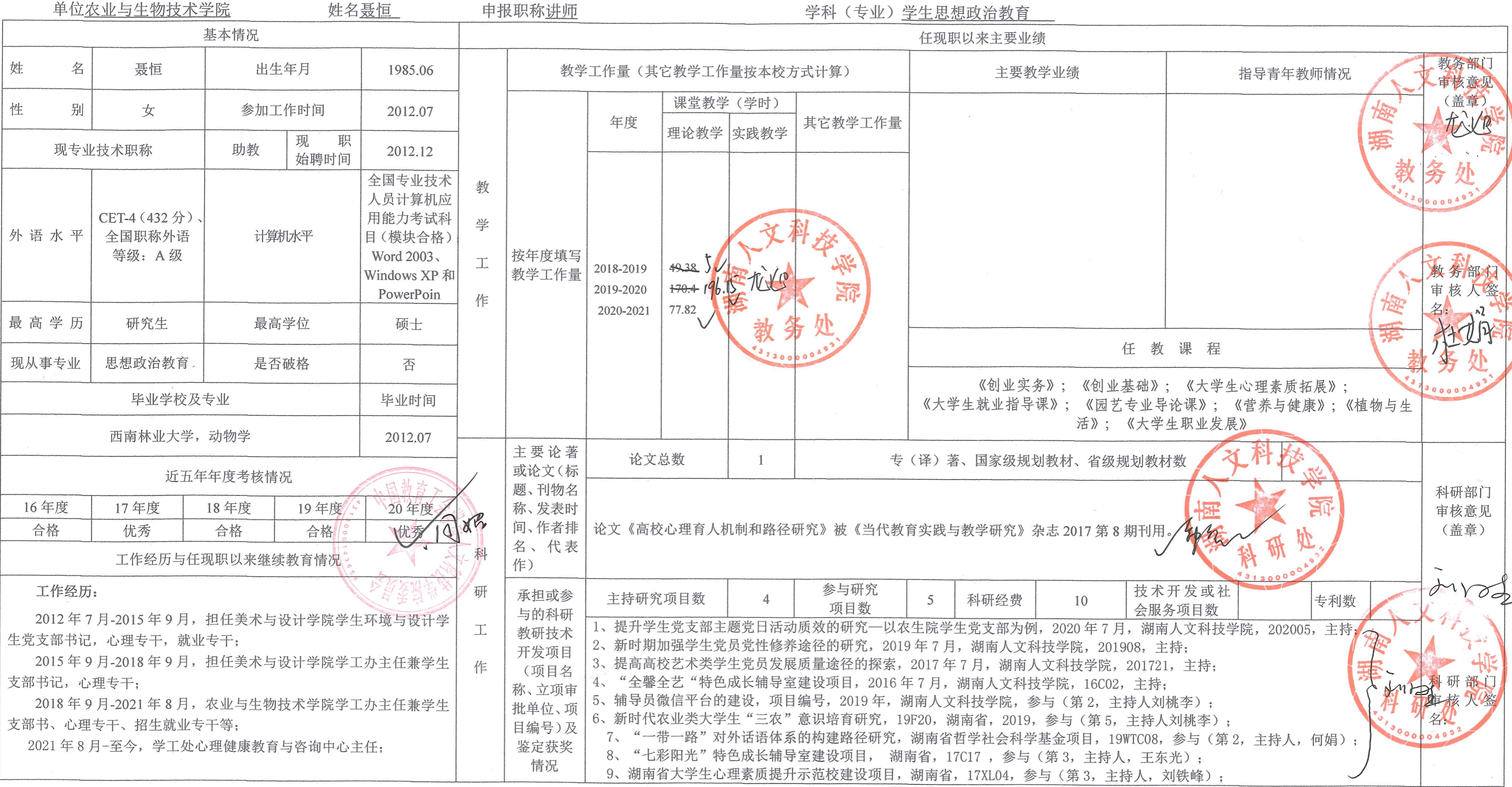
表2 湖南省高等学校教师系列级专业技术职称申报人员情况公示表