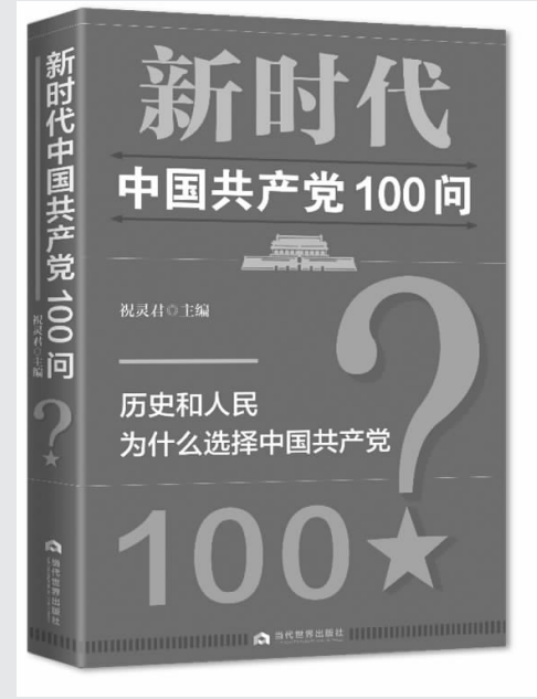
《新时代中国共产党 100 问》 祝灵君/主编 出版社：当代世界出版社

中国共产党是谁？历史和人民为什么选择中国共产党？中国共产党从哪里来、往哪里去？在由中联部主管主办的当代世界出版社于当前出版的《新时代中国共产党 100 问》一书中，可以找到详尽的解答。